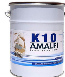
SMALTO PER PISCINE TOP CLASS alla PLIOLITE