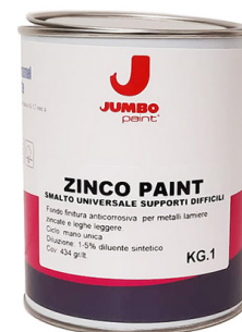
SMALTO PER FERRO PVC LAMIERE ZINCATE

Come fondo-finitura smalto a finire su lamiere zincate, metalli, infissi in Pvc, legno ed mdf con buon potere anticorrosivo e buon aggrappaggio su supporti in ferro e acciaio ove è necessaria una veloce essiccazione e attitudine alla sovraverniciatura con smalti sintetici